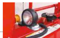
マグネット式ライト 状況に合わせて向きや 位置を変更できます。