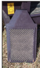
後方カバー (後方通気フィルター付)