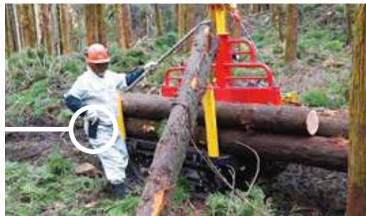
ラジコンウインチで簡単木寄せ キャニコム独自のHST正転・逆転 ラジコンウインチを採用。