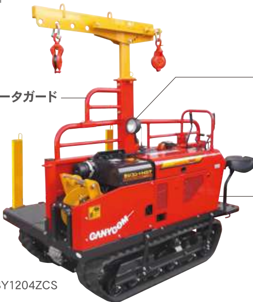
オペレータガード