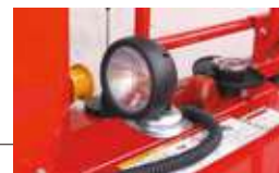
マグネット式ライト 状況に合わせて向きや 位置を変更できます。