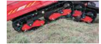
「天城越え」でなめらか〜に♪