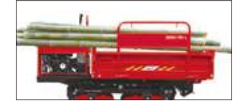
荷台のアーチ移動が可能で、 サイドに移動すれば 長物の運搬も可能です。