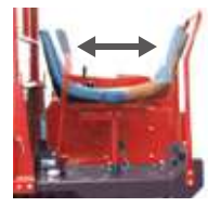
リバーシブルシート 切替えイメージ